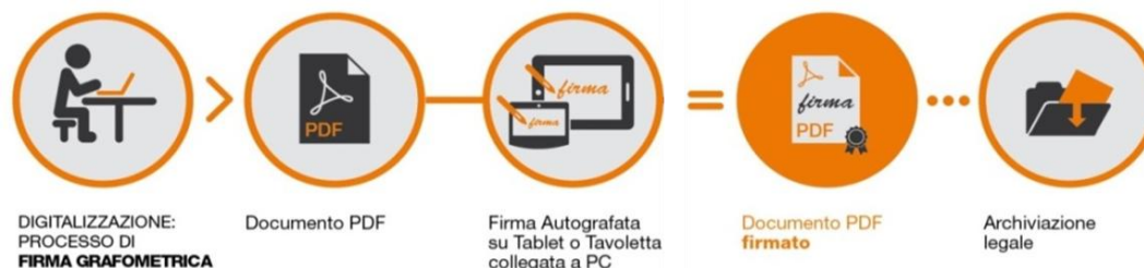
Fig.2 - Schema

I dati cifrati vengono successivamente inseriti nel pdf attraverso la creazione di una firma conforme allo standard europeo denominato PAdES. La soluzione prevede che, a sigillo di ogni firma apposta sul documento dal CLIENTE, sia applicato un certificato rilasciato da NAMIRIAL CA.