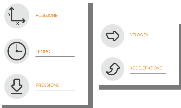
Fig.1 - Schema

Gli elementi disponibili nell'apposizione della sottoscrizione da parte del FIRMATARIO , sono i dati biometrici e comportamentali, quali: Posizione della penna, Pressione, Tratto in aria (percorso che fa la penna quando non tocca nel device, fino a 1cm ), e Tempo. E' possibile elaborare velocità e accelerazione ai fini di analisi forensi.